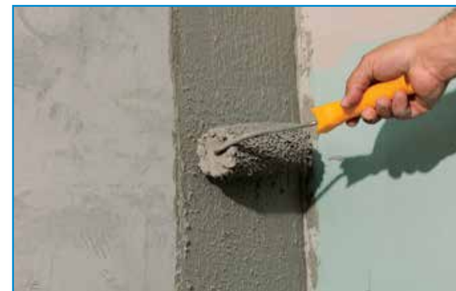
A kenhető szigetelés első rétegét a teljes felületre, sarkokba, élekre is kenjük fel.

Bedolgozhatósági idő: Az anyag a bekeverés befejezésétől kb. ennyi ideig használható fel (átkeverés szükséges lehet)