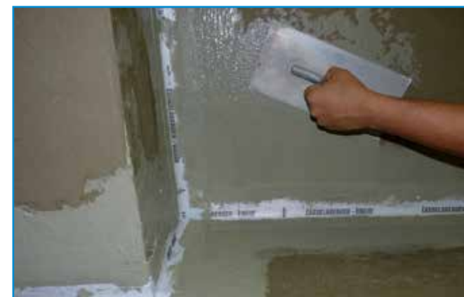
A hajlaterősítés beágyazása után a teljes felületre felhordjuk a második réteg vízszigetelést.