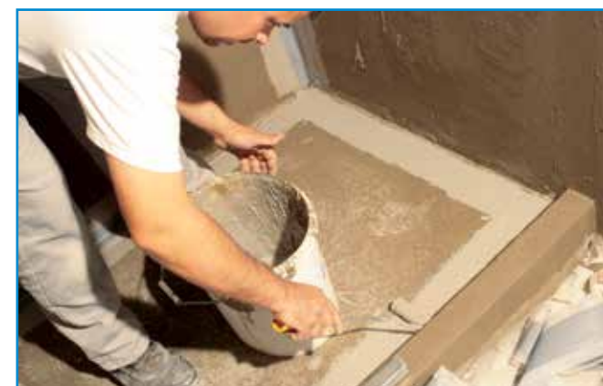
A hajlaterősítő szalag beágyazását az első réteg szigetelés száradása után kezdetjük meg.