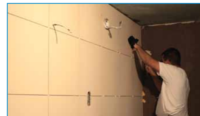
Nehéz, nagyméretű lapok ragasztása is egyszerűen, lecsúszásmentesen megoldható.