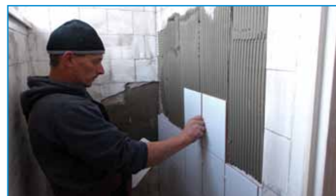
Kontakt B Plusz alapozóval előkészített felületen kezdhetjük meg a lapra lap ragasztást.