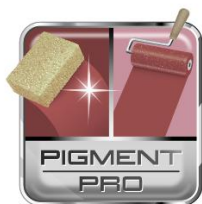
PIGMENT PRO technológia

A Dulux A Nagyvilág Színei a Pigment Pro egyedülálló technológiáján alapuló, beltéri, matt, latex emulzió. A csúcsmínőségű pigmentek optimális koncentrációja kivételes fedőképességet, tartós színeket és mosásállóságot biztosít.