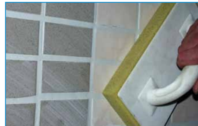
A lemosószivacsot enyhe nyomással húzzuk végig a felületen.