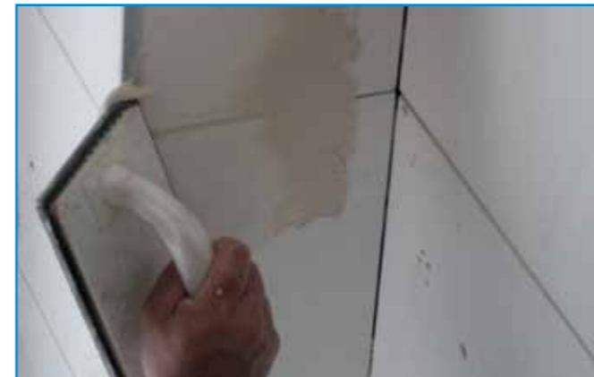
A csatlakozó profilok mentén is használunk fugázóanyagot!