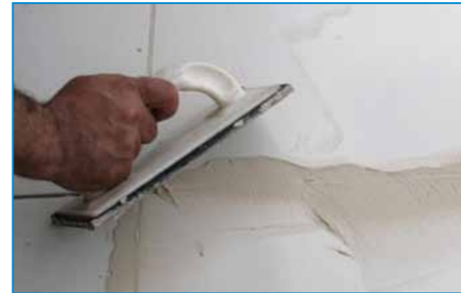
A fugázóanyagot a burkolólapok átlójának irányában hordjuk fel.

Bedolgozhatósági idő: Az anyag a bekeverés befejezésétől kb. ennyi ideig használható fel (átkeverés szükséges lehet)